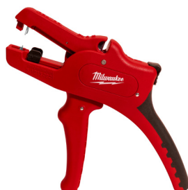
Pince à dénuder automatique