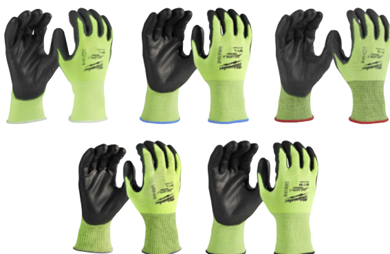
5 nouvelles paires de gants haute visibilité et anti-coupeur Niveau 1/A à 5/E