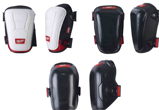
3 nouvelles genouillères : Flexibles - Rigides - Non-marquantes Premium