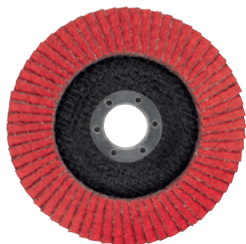
Disque à lamelles céramique XL 5,50 € HT