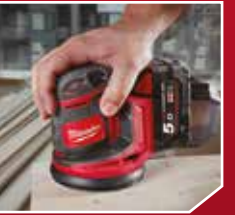
Décapage des laques et peintures des cadres de fenêtre, des chambranles et sur la corniche...