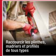
Raccourcir les plinthes, mardriers et profils de tous types