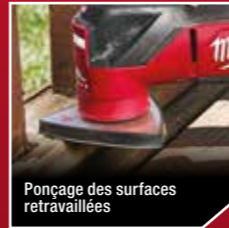
Ponçage des surfaces retravaillées