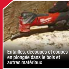
Entailles, découpes et coupes en plongée dans le bois et autres matériaux

Le moteur sans charbons et l'intelligence électronique REDLINK PLUS™ offrent une puissance, une autonomie et une durabilité exceptionnelles