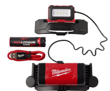
Lampe frontale Prix de vente indicatif : 99,00 € HT

MILWAUKEE® est un fabricant leader dans l'industrie des outils électroportatifs, des accessoires et de l'outillage à main pour les utilisateurs professionnels du monde entier. Depuis la création de l'entreprise en 1924, MILWAUKEE® a mené l'industrie en termes de durabilité et de performances. Avec un engagement ferme envers les professionnels du bâtiment, MILWAUKEE® continue d'exceller en mettant l'accent sur le déploiement de solutions innovantes et spécifiques aux besoins de chaque métier.