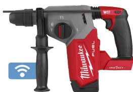
Perforateur-burineur SDS-PLUS M18 ONEFHX 26 mm