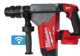
Perforateur-burineur SDS-PLUS M18 ONEFHPX 30 mm