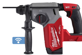
Perforateur-burineur SDS-PLUS M18 ONEFH 26 mm