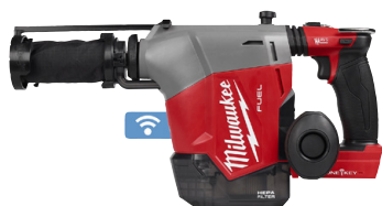
Perforateur-burineur SDS-PLUS 2-MODES M18 FHAFOH16 16 mm