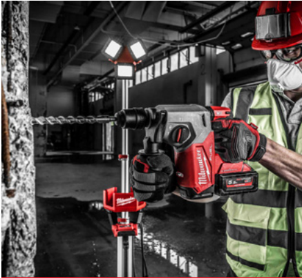
Perforateur-burineur M18 ONEFHX SDS-PLUS 26 mm