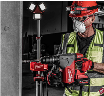
Perforateur-burineur M18 ONEFHPX SDS-PLUS 32 mm