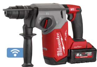
Perceur-burineur SDS-PLUS M18 ONEFHX 26 mm