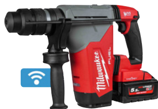
Perceur-burineur SDS-PLUS M18 ONEFHPX 32 mm