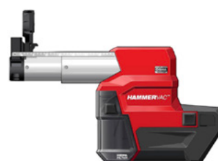
Système d'aspiration SDS-PLUS M18 FPDDEXL-0