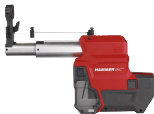
Système d'aspiration SDS-PLUS M18 FDDEXL-0