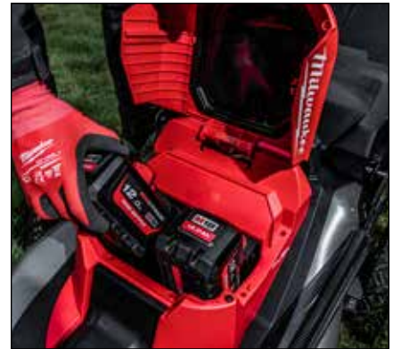
ZWEI AKKU- STECKPLÄTZE