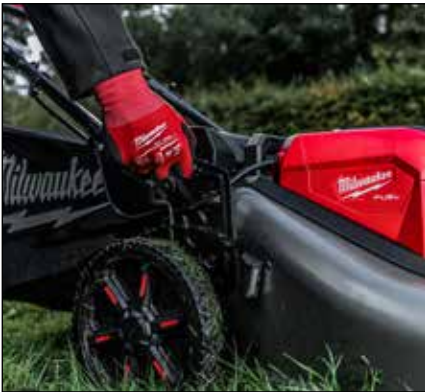
7-FACHE ZENTRALE HÖHENEINSTELLUNG