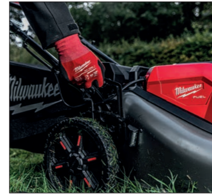
7-FACHE ZENTRALE HÖHENEINSTELLUNG