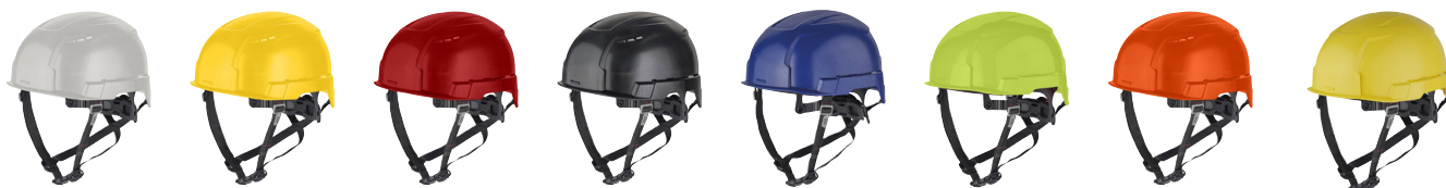
Casque BOLT™ 200 - Disponible en 7 coloris + 1 version Jaune haute visibilité

Pour répondre à la réglementation en vigueur et participer à la réduction des risques sur les chantiers, MILWAUKEE® poursuit donc le développement de sa gamme d'équipement de protection pour les professionnels (EPI) avec une gamme de casques et d'accessoires haute protection.