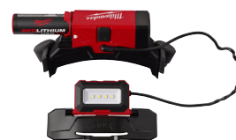
Lampe frontale BOLT™ 200