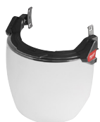
Écran de protection yeux et visage BOLT™ 200