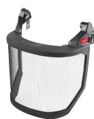
Écran d'élagage BOLT™ 200