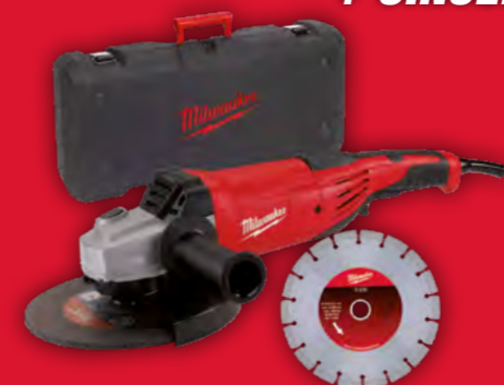
AG 22-230 DMS-DSET Amoladora 2.200W, 230mm, DMS, con maletín y disco general de obra (4933440292)