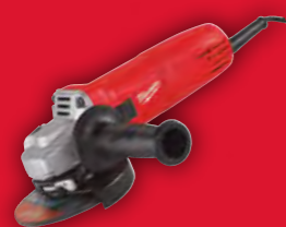
AG 10-125 EK Miniamoladora 1.000W, 125mm (4933451220)