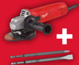
Cinzel y puntero*