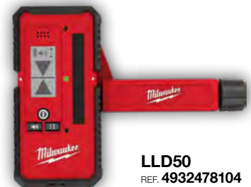
LLD50 REF. 4932478104

Detector de láser 50m, para láser verde, precisión 0,15/0,2mm en 1m y protección IP54. Se suministra con soporte y 2 pilas AA.