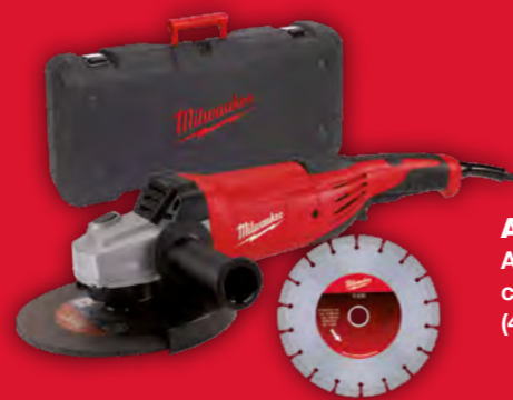
AG 22-230 DMS-DSET Amoladora 2.200W, 230mm, DMS, con maletín y disco general de obra (4933440292)