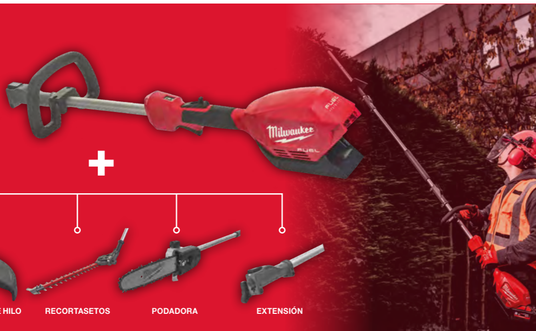
MARCABORDES DESBROZADORA DE HILO RECORTASETOS PODADORA EXTENSIÓN